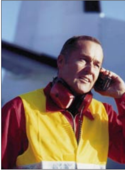
Dolphin Telecom führt ein neues Mobilfunknetz ein, das professionellen Anwendern preiswerte, schnelle und sichere Kommunikation in ganz Europa ermöglicht.