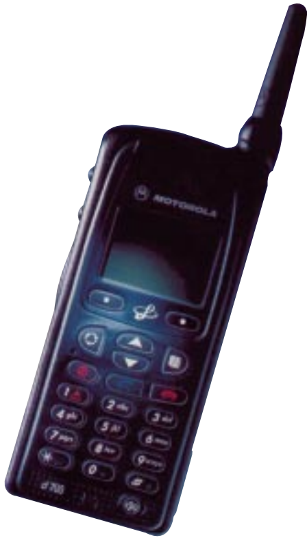
TETRA ist ein neuer Standard für digitale Sprach- und Datennetze, der von der ETSI, der European Telekom Standard (European Telecommunications Standards Institute), speziell für professionelle Anwender konzipiert wurde.

triebsinformationen, Pressemeldungen, interne Mitteilungen und Daten über laufende Marketingaktivitäten; ein internationales Adressbuch liefert alle im täglichen Einsatz benötigten Adressinformationen und abteilungsinterne Abstimmungsdatenbanken erleichtern die Zusammenarbeit von einzelnen Gruppen.